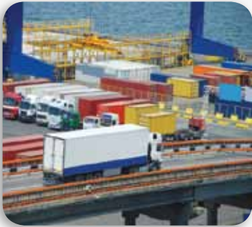
تأمين مسؤولية الناقل