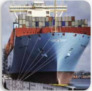
تأمين أجسام السفن التجارية واليخوت