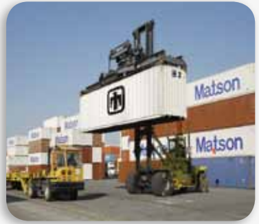
تأمين المسؤوليات البحرية