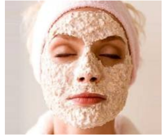
هل تعاني من التجاعيد؟ كافة التجاعيد سوف تختفي خلال 30 يومًا