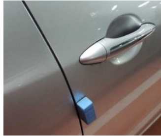
سر وجود قطع إسفنج على أبواب السيارات الكورية. للتفاصيل