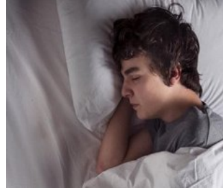
هل تعلم لماذا نستيقظ في نفس الوقت من كل ليلة؟