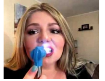
الطريقة الأولى في عالم تجميل الأسنان أصبحت بين أيديكم ومتاحة في المنزل طرق مجربة