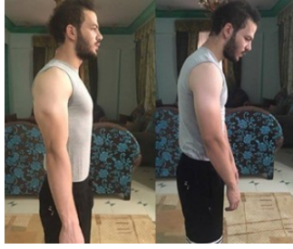
الحل الجذري لجميع مشاكل إنحناءات الظهر وتقوساته علاج تقوس الظهر