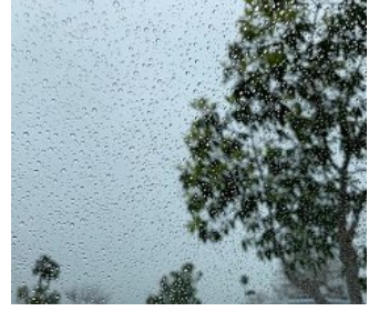
طقس العرب: زخات من الأمطار الليلية