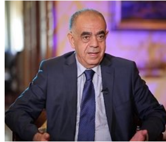
الدكتور محمد الحلايقة يدلي بتصريحات خطيرة