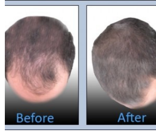
تخلصت من فراغات شعري بخطوة واحدة فقط صحة وجمال