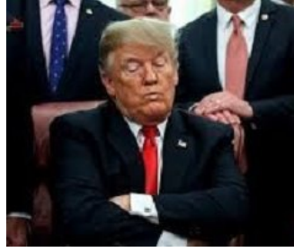
تفاصيل قرار ترامب المرتقب ضد النساء الحوامل