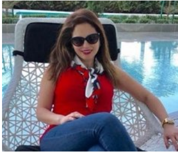
وزيرة اعلام أم ملكة جمال؟