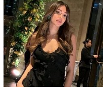
سعودية تواجه غضبا عارما بسبب فيديو بملابس كاشفة