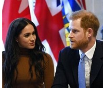
القصر الملكي يُعلن طلاق الأمير هاري وميغان ماركل!