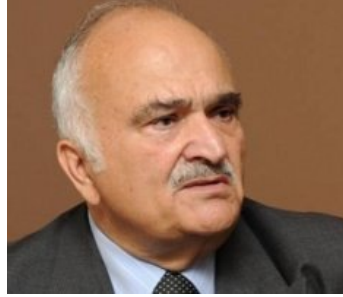
عاجل : شاهد بالفيديو .. الأمير الحسن يعلق على "صفقة القرن" ..