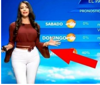
عندنا تكون المذبةعة جديدة على الهواء مباشرة... أنظروا ماذا فعلت !!