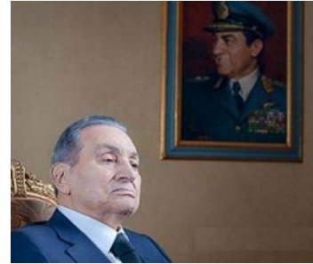
إقامة جنازة عسكرية لـ«مبارك»

الامن يحذر السائقين من الانجماد خلال الساعات القادمة