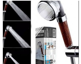
لأول مرة اختراع يعطيك استحمام مثالي مع ضخ ماء قوي.. قل وداعاً للكلس والكلور! جربه الآن