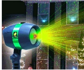
تميز وأجعل من منزلك تحفة فنية ويتألق بالأضواء الليزرية الجميلة طرق مجربة