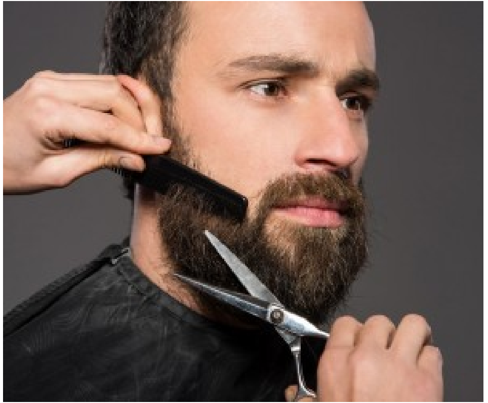
شعر لحية كثيف كالأتراك طرق مجربة