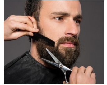
لحية كثيفة أكثر لمعاناً بلا فراغات ومفعمة بالرجولة طرق مجربة