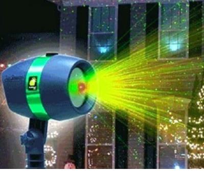
تميز وأجعل من منزلك تحفة فنية ويتألق بالأضواء الليزرية الجميلة