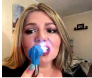
الطريقة الأولى في عالم تجميل الأسنان أصبحت بين أيديكم ومتاحة في المنزل طرق مجربة