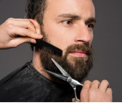
شعر لحية كثيف كالأتراك